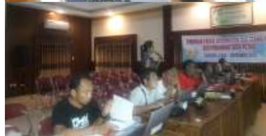
Gambar 1. Pelaksanaan kegiatan

Materi yang digunakan dalam pelatihan editing video ini dapat dijelaskan sebagai berikut: